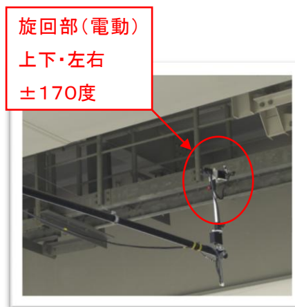
旋回部(電動) 上下・左右 ±170度